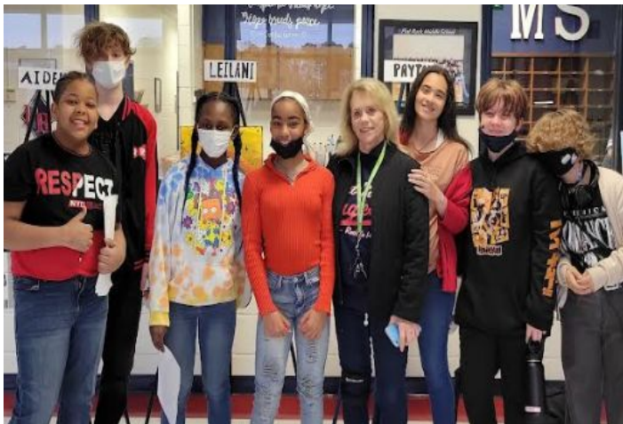
Ms. Matson & Art Battle Participants